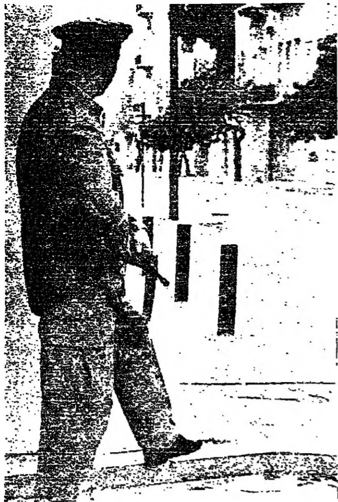
رجل أمن يراقب الوضع في شارع القطاري